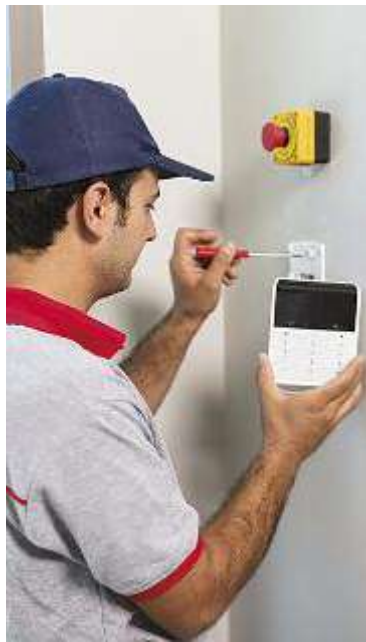
↑ Questi strumenti vanno posizionati in punti strategici della casa

Tra i tanti sistemi, quelli wireless sono tra i più popolari, forse pro-