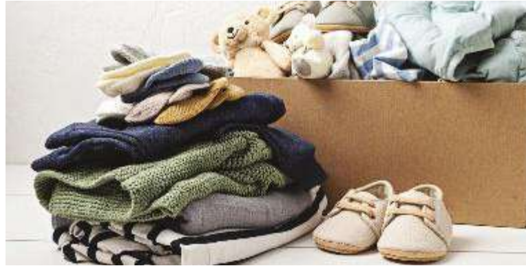
↑ Il pericolo, per i più piccoli, può arrivare da vari fattori, tra cui l'abbigliamento

Consigli / Prima di acquistare abbigliamento per bambini, meglio informarsi se è conforme alle norme