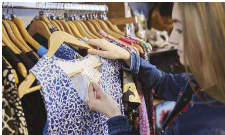
↑ Tante le regole da seguire, tra queste quella del controllo delle etichette