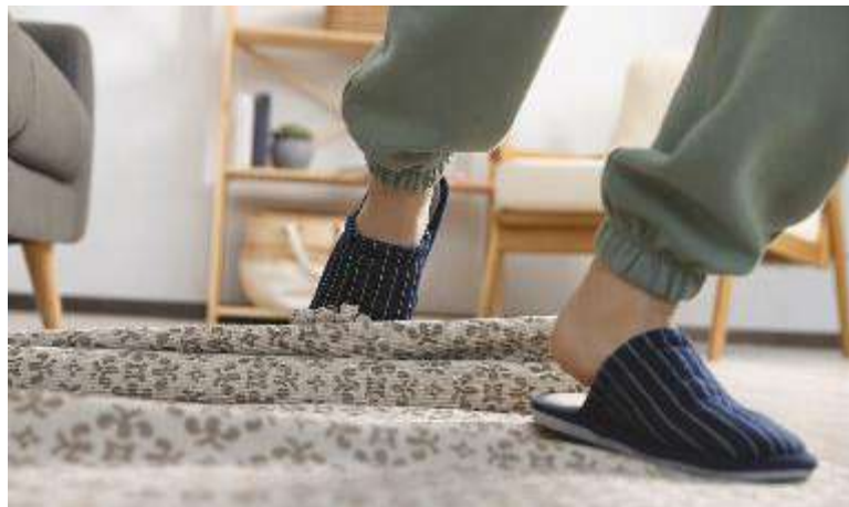
↑ Negli ultimi anni si è assistito a un aumento degli infortuni domestici

Per aderire alle nostre iniziative e comunicare sui nostri speciali contatta il numero 051 6033848 o scrivici a spe.bologna@speweb.it . Visita gli speciali on line su: ilrestodelcarlino.it - lanazione.it