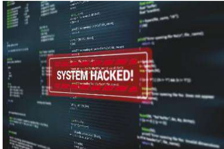
↑ In Italia, nel 2022, sono stati calcolati 1.094 attacchi cibernetici mirati

infrastrutture critiche, per l'Italia lo è stato ancora di più: sono stati calcolati qualcosa come 1.094 attacchi cibernetici mirati (in media circa 90 ogni mese), che hanno interessato e, di conseguenza, procurato danni in particolare al comparto sanitario e a quello energetico. Ma come si manifestano questi attacchi e quali problemi procurano? Dall'analisi degli eventi cyber, così come riportato nella relazione annuale, è stato possibile individuare le tipologie più ricorrenti: diffuso-