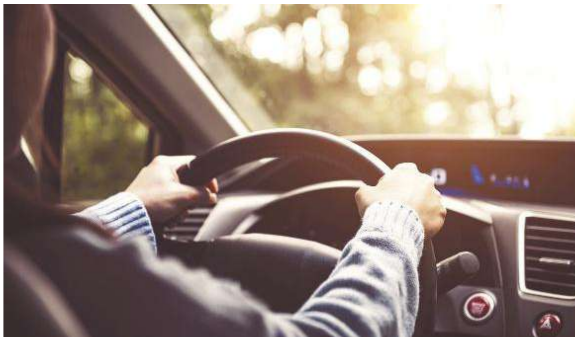
↑ Cinture di sicurezza, attenzione alla guida e controlli regolari al veicolo: tutti aspetti da tenere sempre ben presenti

Superare i limiti di velocità è la causa maggiore di incidenti