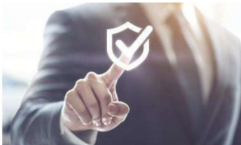
↑ Quello della cybersicurezza è un settore in rapida evoluzione