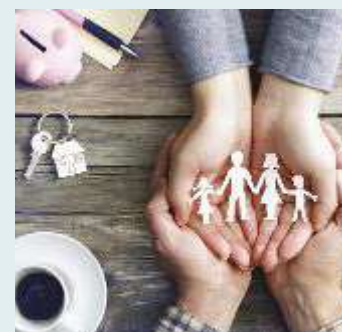
↑ Più risorse al Fondo di sostegno per le famiglie delle vittime di gravi infortuni sul lavoro

Con l'adozione del Decreto del Ministro del Lavoro e delle Politiche Sociali, che integra con 5 milioni di euro le risorse del Fondo di sostegno per le famiglie delle vittime di gravi infortuni sul lavoro (per eventi compresi tra il primo gennaio e il 31 dicembre 2023), aumentano gli indennizzi a sostegno delle famiglie. A beneficiare del fondo, oltre al coniuge, anche figli legittimi, naturali, adottivi fino al 18° anno di età; fino al 21° anno se studenti di scuola media superiore o professionale; fino al 26° anno d'età se universitari; in caso di maggiorenni inabili finché dura l'inabilità. In mancanza di coniugi o figli: genitori, naturali o adottivi, se a carico del lavoratore deceduto; fratelli e sorelle se a carico o conviventi.