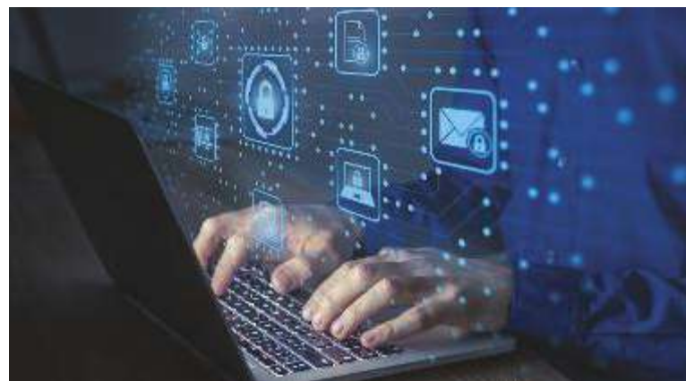
↑ Dal 1° febbraio 2024 Google richiederà di autenticare le email tramite SPF/DKIM e DMARC per rafforzare le difese contro lo spoofing e il phishing

Google promette una lotta senza quartiere ai cybercriminali: per rafforzare la sicurezza dei suoi utenti, già a partire dal nuovo anno, il colosso tecnologico metterà in atto una serie di accorgimenti per impedire che spam, phishing e malware possano raggiungere le caselle di posta elettronica. Saranno introdotti specifici requisiti per coloro che, giornalmente, inviano più di 5000 messaggi a indirizzi Gmail ("mittenti di massa"). Dal primo febbraio 2024 Google richiederà di autenticare le email tramite SPF/DKIM e DMARC per rafforzare le difese contro lo spoofing e il phishing, inoltre, questi cosiddetti "mittenti" dovranno permettere ai destinatari Gmail, in tempi brevi e facilmente, di annullare l'iscrizione alla posta commerciale. La vera novità, però, è l'introduzione per i mittenti di una soglia di tasso di spam inferiore allo 0,3%, questo per garantire che i destinatari Gmail non siano bombardati da messaggi di posta indesiderati.