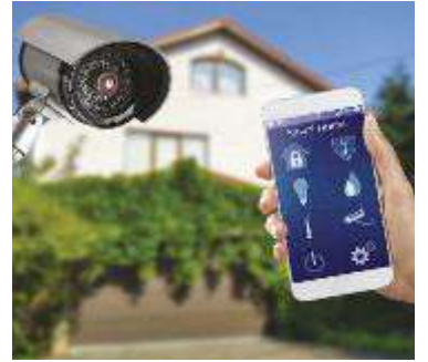
↑ Anche lo smartphone diventa essenziale per la nostra protezione

Il YISEELE Allarme casa Senza fili è un sistema di sicurezza domestica completo e di semplice installazione, composto, oltre che da una stazione base di allarme, da ben 10 sensori per porte e finestre, un rilevatore di movimento anti-animale domestico e due telecomandi con sirena: la soluzione ideale per proteggere la casa. Una delle principali caratteristiche di questo allarme è la compatibilità con Alexa e Google Assistant. Completo e versatile il AGSHOME Sistema di Allarme Casa Senza Fili si compone, oltre che di una stazione base, di ben 10 sensori. Una delle caratteristiche principali di questo sistema è che, una volta attivato, è possibile ricevere avvisi e notifiche in tempo reale direttamente sullo smartphone. Decisamente