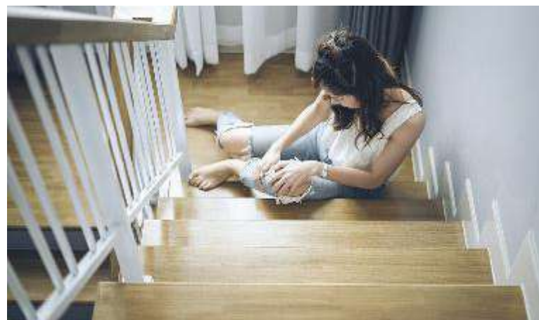
↑ Le cadute sono l'incidente più frequente tra le mura domestiche: 55% dei casi

Per evitare di correre rischi in casa propria, è meglio conoscere e valutare l'appropriatezza dei nostri comportamenti: le statistiche indicano che il 34% degli infortunati, prima dell'incidente, stava svolgendo un'attività domestica. Ma qual è il luogo più pericoloso della casa? Per la presenza di fonti di calore, utensili vari ed elettrodomestici, la cucina è di gran lunga il luogo più pericoloso: qui avvengono oltre il 40% degli incidenti domestici (è recente il tragico episodio dell'uomo che è inciampato sullo sportello della lavastoviglie finendo su un coltello).