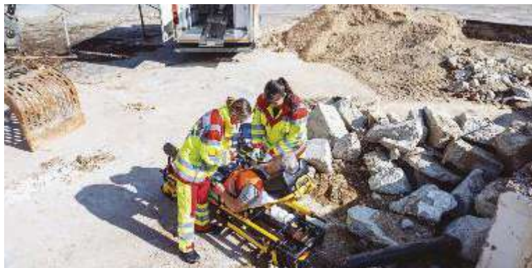
↑ Nei primi otto mesi del 2023 si sono registrati 383.242 infortuni sul lavoro

Statistiche / Il Rapporto annuale dell'INAIL sui primi otto mesi fa registrare un -20,9% rispetto al 2022