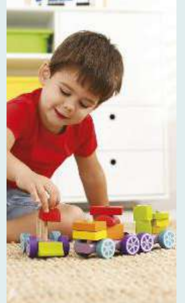
↑ Nel 2022 i giocattoli sono risultati tra i prodotti più segnalati per pericolosità, con il 23% degli alert

Per il Safety Gate (sistema europeo di allerta rapido per i prodotti pericolosi non food) a cui aderiscono gli Stati membri dell'Ue, nel 2022 i giocattoli sono risultati tra i prodotti più segnalati per pericolosità con il 23% degli alert. In Italia, secondo quanto previsto dal Dlgs n.11/2021 (che definisce giocattoli "gli articoli progettati o destinati in modo, esclusivo o meno, a essere utilizzati per fini di gioco da bambini di età inferiore a 14 anni") per garantire un acquisto più sicuro è consultabile un apposito archivio "prodotti pericolosi", contenente segnalazioni effettuate dalla Direzione Generale della Prevenzione del Ministero della Salute e riferite unicamente al mercato italiano.