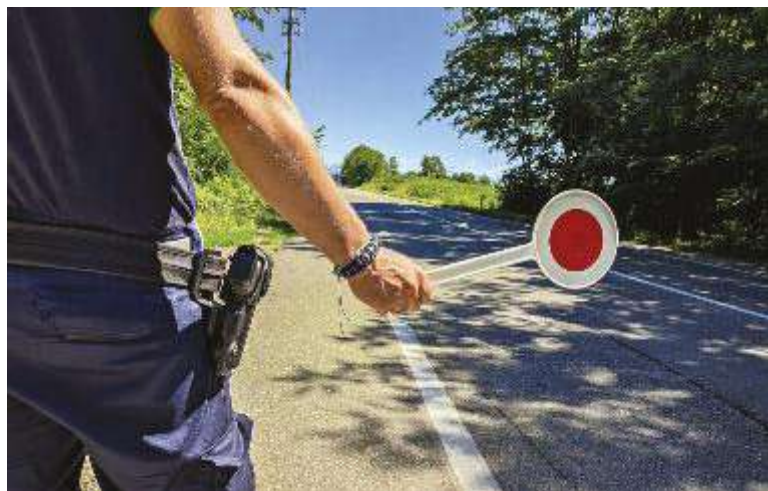
↑ Controlli più frequenti e sanzioni più severe per chi guida in stato di ebbrezza