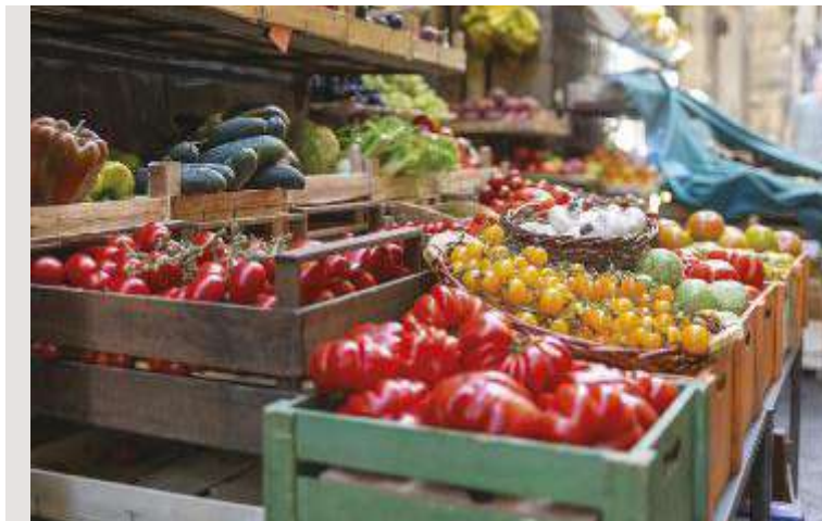
↑ Per ridurre il rischio sono necessari controlli accurati dei processi di produzione

Ma quali sono le maggiori problematiche in cui possono incorrere i consumatori? Sono numerose e, purtroppo, anche ricorrenti le emergenze sanitarie assunte all'onore della cronaca negli ultimi anni: si va dalla famigerata "mucca pazza" all'influenza aviaria, dai "polli alla diossina" sino ai più recenti casi riscontrati in Sardegna di trichinellosi e di tossine, ad azione paralizzante, nei mitili e, questo, solo per citarne alcuni tra i più noti; del resto la stessa globalizzazione, che consente alle aziende alimentari di importare anche da Paesi extracomunitari sia materie prime che semilavorati, fino agli alimenti direttamente pronti per il consumo sulle nostre tavole, può comportare un fattore di rischio. Sicurezza alimentare, quindi, non vuol dire assenza di rischi, quanto piuttosto